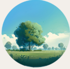
Gaz à effet de serre d'origine anthropique

Trouvez la solution pour préserver l'humanité et la biodiversité face aux défis climatiques !