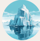
Scénarios climatiques et montée des eaux