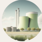
Énergies et leurs émissions CO2