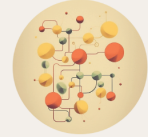
Pouvoir du réchauffement Global

Le défi de la prochaine heure est capital !